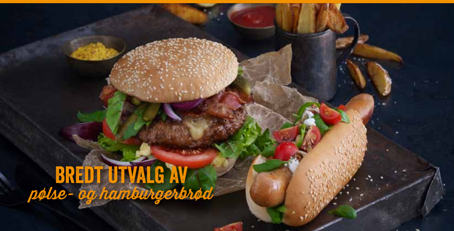
BREDT UTVALG AV pølse- og hamburgerbrød