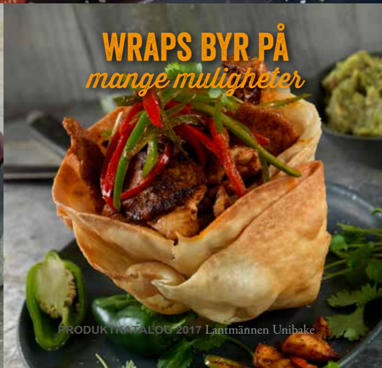
WRAPS BYR PÅ mange muligheter